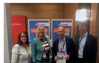
... der stellv. Fraktionsvorsitzenden im Landtag Petra Vogt (2 v.l.)