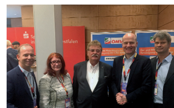
... CDU/CSU-Fraktionschef Ralph Brinkhaus und „Mr. EU“ Elmar Brok