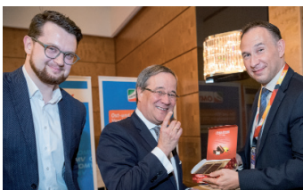
... unserem Ministerpräsidenten und CDU-Landeschef Armin Laschet