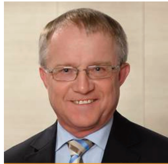
Beauftragter Rüdiger Scholz MdL

Dokumentations- und Ausstellungszentrums zur Geschichte der deutschen Minderheit in Oppeln sowie die Renovierung der Vereinsschule in Oppeln-Malino die wichtigsten Anliegen der deutschen Minderheit bei meinem Besuch in Oberschlesien im April