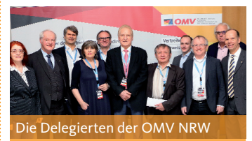
Die Delegierten der OMV NRW